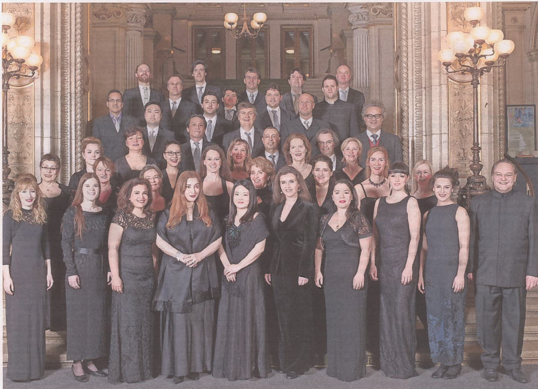
BLANKPOLERT KLANGKULTUR: Her er blankpolert klangkultur. Her er knivskarp artikulasjon. Her er formidabel fylde i de store utladningene, skriver vår anmelder.